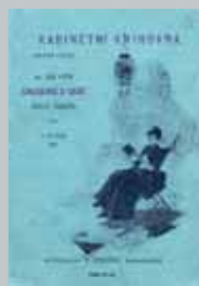
Guthova Causerie z cest po Španělsku vyšla v nakladatelství F. Šimáček v roce 1894 (Památník národního písemnictví).