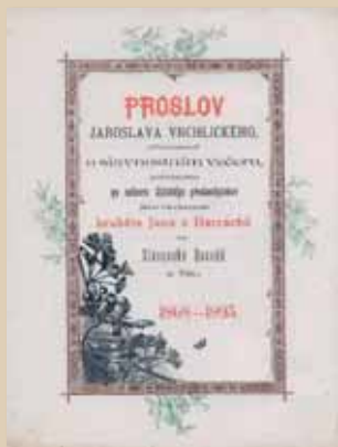
Věrovaná chvalořeč Jaroslava Vrchlického na hraběte Harracha, která vyšla tiskem v roce 1893, dokládá jeho mimořádný význam pro český život ve Vídni (Krkonošské muzeum v Jilemnici)

V čase prvního otevření Národního divadla publikoval Harrach v časopise Osvěta brilantní studii o neutěšených poměrech početné české menšiny ve Vídni. V součinnosti se Slovanskou besedou, v jejímž čele stál, a spolkem Komenských založil ve Vídni českou školu, vymohl konání bohoslužeb v čestině a výrazně oživil zdejší spolkový život. Jen na zakoupení českého kostela věnoval částku 200 000 korun! Označte otec vídeňských Čechů mělo v té době hluboký smysl a charakterizovalo vztah hraběte k české menšině.