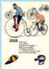
Ilustrace Kamila Lhotáka z Hrubínovy knihy To je jízda, to je let (Památník národního píseňnictví).

Lešany, Chlum u Třeboně a Praha byla místa, která inspirovala Hrubína básníka. Chlum ho inicioval při psaní básní, které ho znovu navrátily do literatury v polovině padesátých let, rytmus prázdninového času, typy domácích i hostů, kteří sem přijížděli, byly mj. předobrazem jeho první původní divadelní hry Srpnová neděle (1958).