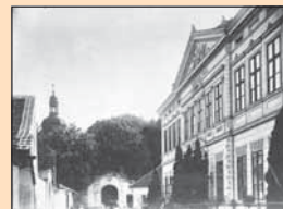
Nové Benátky, dnes část města Benátek nad Jizerou, škola před přestavbou v roce 1904.