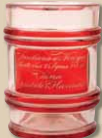
Holbička s nápisem „Faukand w Nowym Swiętę dne 25. srpna 843 od Jána hraběte z Harracha“ (Krkonošské muzeum v Jilemnici)

V padesátých letech 19. století se začal hrabě Harrach intenzivně věnovat osvětě v oblasti zemědělství. V roce 1863 založil ve Stěžeřech na Královéhradecku rolnickou školu. Psal dokonce spisky pro šlechtice poněkud neobyčejně, například Krátké naučení o důležitosti dobytka dojného, kterak dlužno rozumně jej chovati a jakých vad se vystrhávati (1864).