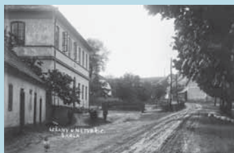
Škola v Lešanech. Fotografie Josefa Dvořáka z třicátých let 20. století (Sbírka Vojtěch Pavelčík).