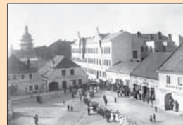
Svčenejší pohled přes původní zástavbu náměstí. Kalistovi zde bydleli až do tatínkova odchodu do penze, tedy do roku 1920 (Památník národního písemnictví).