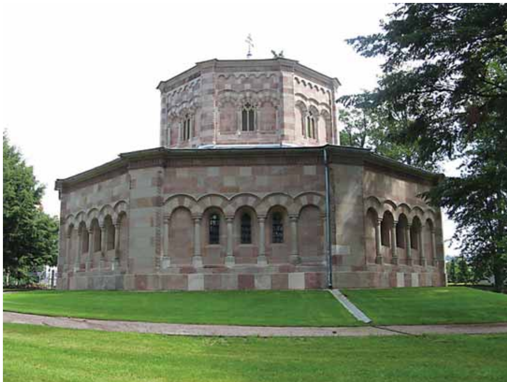
Hrobka Harrachů v Horní Branné