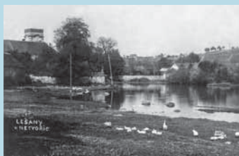
Rybník Návěsník v Lešanech. Vlevo zámecký areál. Fotografie Josefa Dvořáka z třicátých let 20. století (Sbírka Vojtěch Pavelčík).