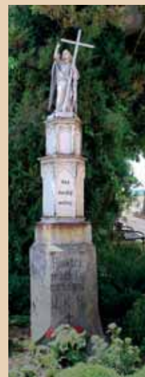
Pomník J. K. Rojka na hřbitově v Budyni nad Ohří