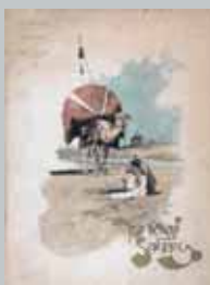
Vzpomínky a dojmy z cest po Alžírsku vylíčil Guth v knize Na pokraji Sahary , která vyšla u Jos. R. Vilímka v roce 1892 s ilustracemi Viktora Olivy (Památník národního písemnictví).