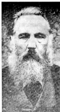
チェスノフリーデク

チェフの膨大な詩や散文の作品は壮大な叙事詩集 (「ヨーロッパ Evropa」, 「スラーヴィエ Slávie」), 歴史的詩集 (「ジシユカ Zizka」, 「ダグマル Dagmar」), 政治的な抒情詩集 (「朝の歌 Jitřní písně」, 「新しい歌 Nové písně」), 詩の風刺集 (「ハヌマン Hanuman」), 田舎の生活を描写した牧歌的な詩の物語集 (「菩提樹の木陰で Ve stínu Lípy」) などが含まれる。最も名声を博したのは 1883 年の彼の詩的な社会的小説、「レシェチンスキーの鍛冶屋