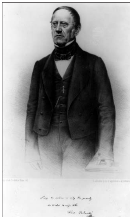
Portrét Františka Palackého z roku 1861