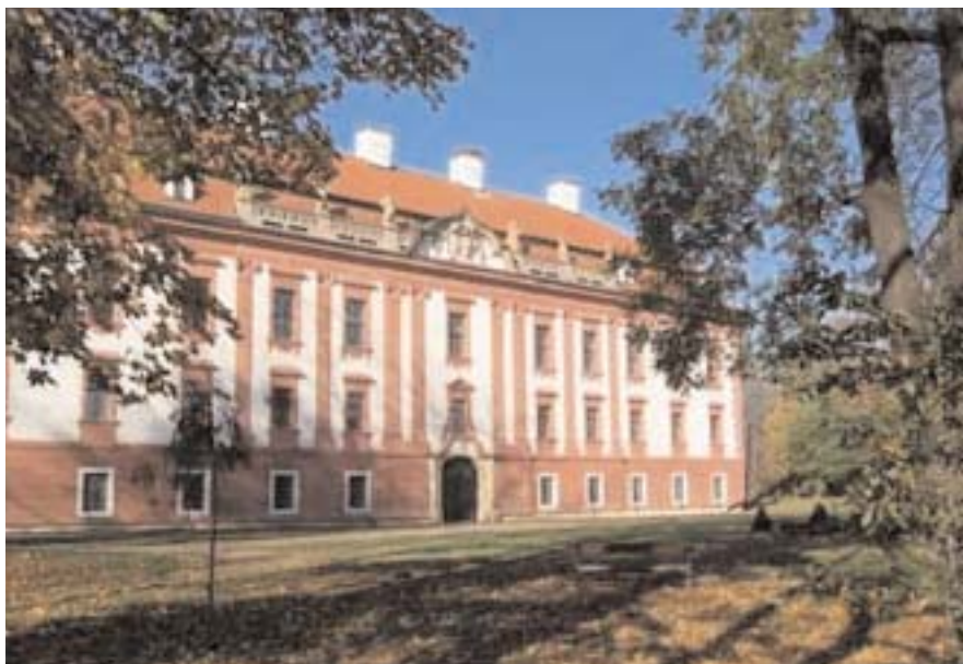
Barokní zámek v Kuníně u Nového Jičína, kde se v letech 1807 až 1809 vzdělával mladý František Palacký.